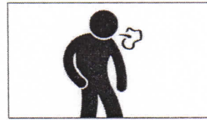
Husten Кашель cough toux سعال