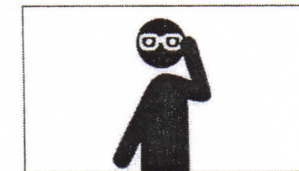
schlecht sehen bad seeing voir mal ضعف الرؤية Плохое зрение