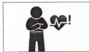
Herzrasen Повышенное racing heart сердцебиение accélération du rythme cardiaque خفقان القلب