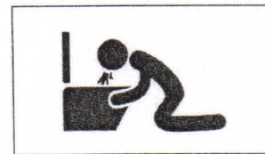
Erbrechen Рвота vomiting vomissement تقيؤ