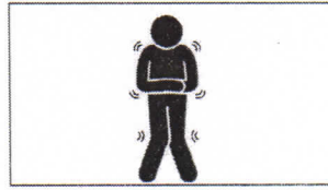
Frieren Ozноб freezing avoir froid يتجمد