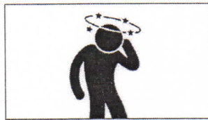
Schwindel Головокружение dizziness vertiges دوخة