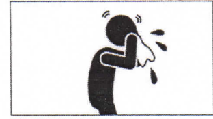
Schnupfen Насморк sniffing rhume زكام