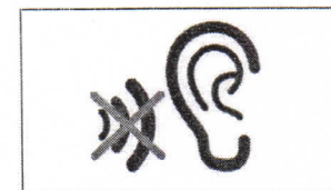
schlecht hören poor hearing entendre mal ضعف السمع Плохой слух