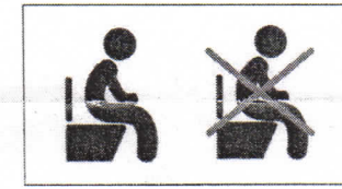
Durchfall / Verstopfung diarrhoea / constipation diarrhée / constipation إسهال / إمساك / Понос / запор