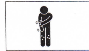
Juckreiz Зуд itching démangeaison الحكة