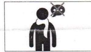
Heiserkeit Охриплость hoarseness enrouement بحة في الصوت