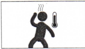
Fieber Температура fever fièvre حمى