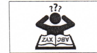
nicht lesen können can't read être analphabète لا يستطيع القراءة Не могу читать